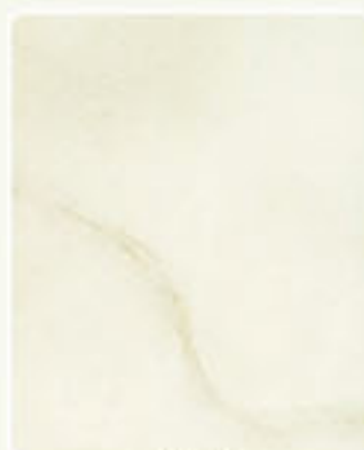
VERDE 65 48