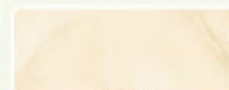
ROSSO 96 49