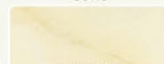
AMARELO 96 47