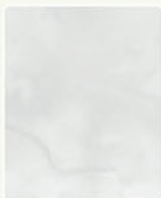
GRIGIO 65 45