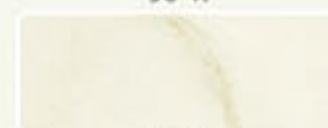
VERDE 96 48