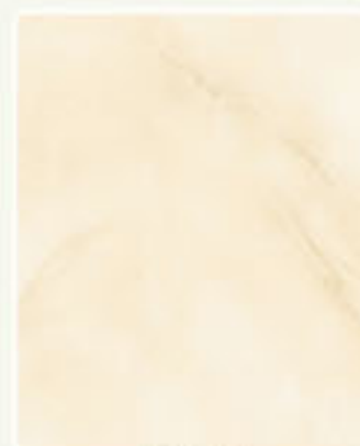
ROSSO 65 49