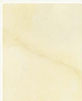
AMARELO 65 47