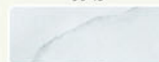
AZURRO 96 46