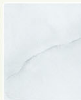
AZURRO 65 46