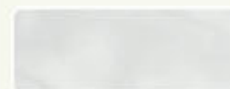
GRIGIO 96 45