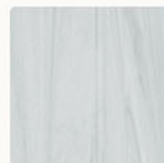
SZARY 55 29