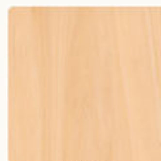
BEŻOWY 55 28